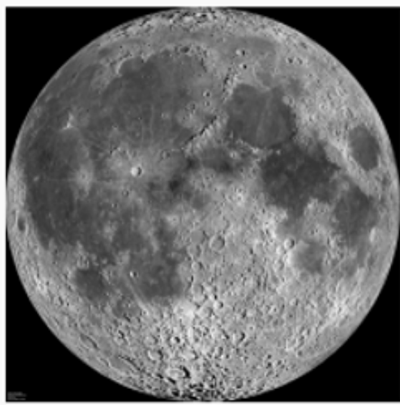
Face visible de la Lune